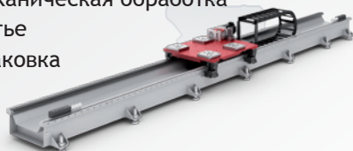
TMF - классическое напольное исполнение