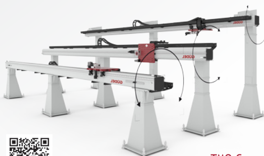
TMO-C - потолочное исполнение