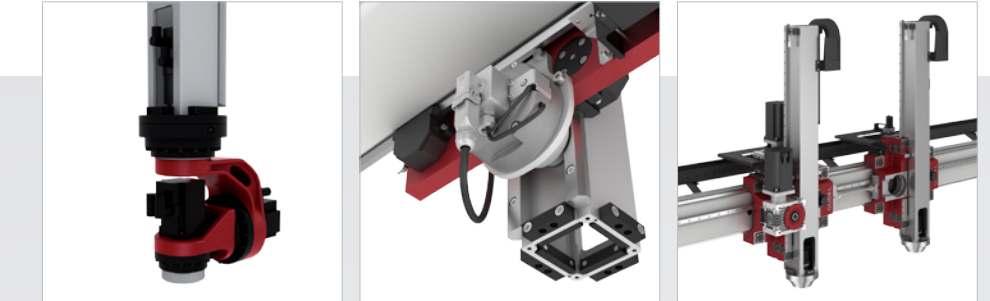
Ось С Ось С-В Ось С-В-А

Для более подробной информации посетите наш сайт www.gudel.com или обратитесь к нам напрямую. Охотно проконсультируем Вас по всем вопросам.