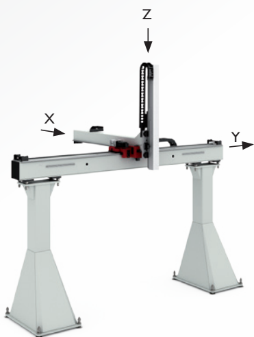
CP - triple-axis linear module